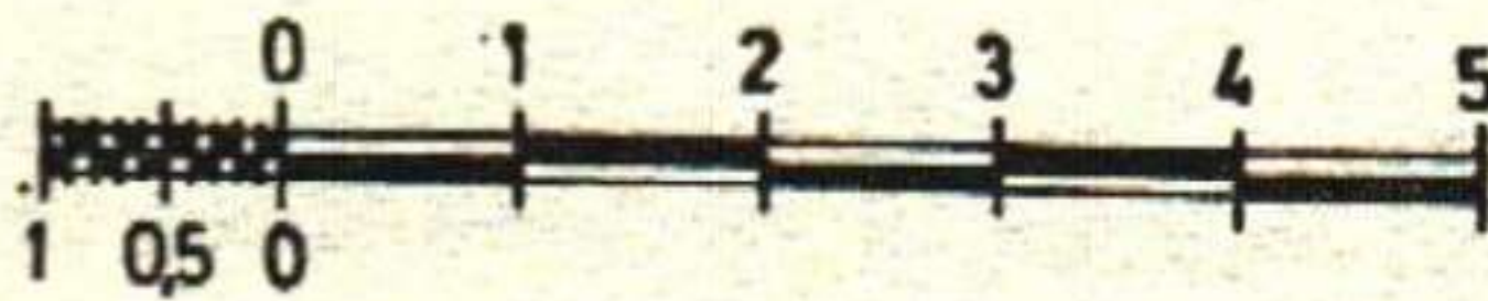
SANT QUINTÍ DE CASTELLBISBAL